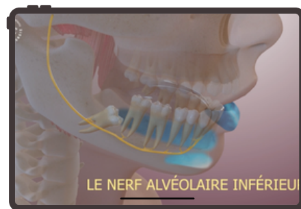
DES GRAPHISMES 2D ET 3D

Un parcours numérique de 7 min expliquant et illustrant par des vidéos 2D et 3D les indications, le déroulé de l'intervention, ses suites et les éventuelles complications de l'intervention d'avulsion des dents de sagesse aboutit à une feuille d'information pré-opératoire signée puis à un consentement électronique envoyé en double exemplaire au patient et au chirurgien.