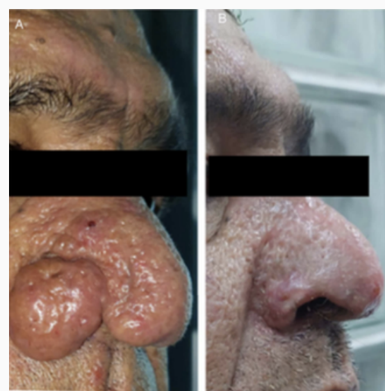
Figure 3 : Patient 1 avant et après la chirurgie